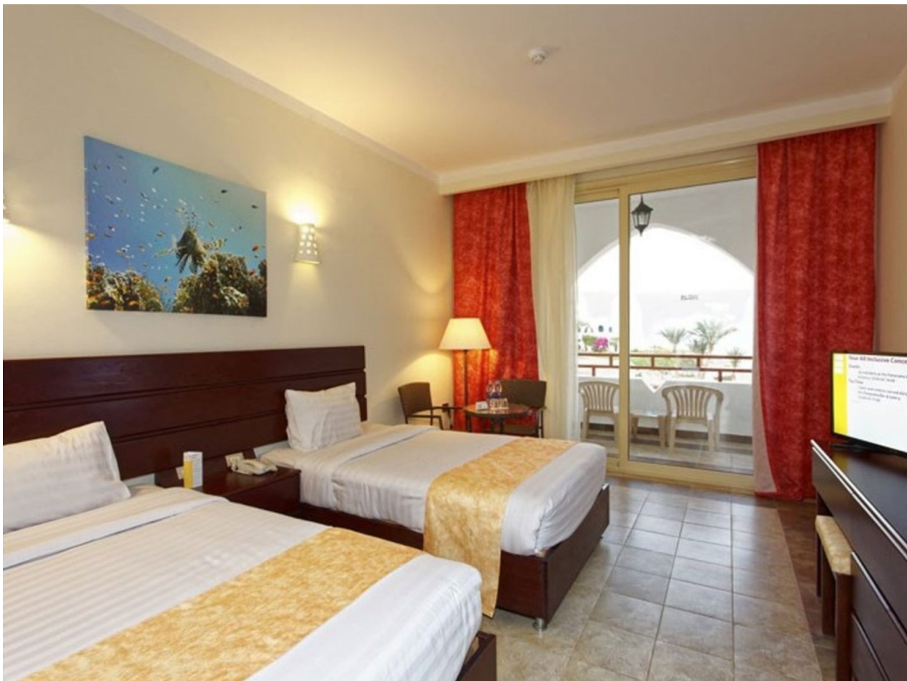
Wohnbeispiel Premium Sea View Room